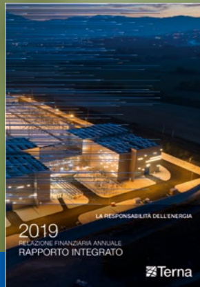
Relazione Finanziaria Annuale Rapporto Integrato