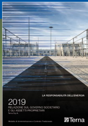
Relazione sul Governo Societario e gli Assetti Proprietari

Sono il risultato finale di una serie di scelte precise in termini di trasparenza, comunicazione, correttezza, completezza e connettività delle informazioni e il culmine di un insieme di processi complessi che coinvolge persone di molte strutture aziendali.