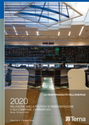
Relazione sulla Politica di Remunerazione e sui Compensi Corrisposti